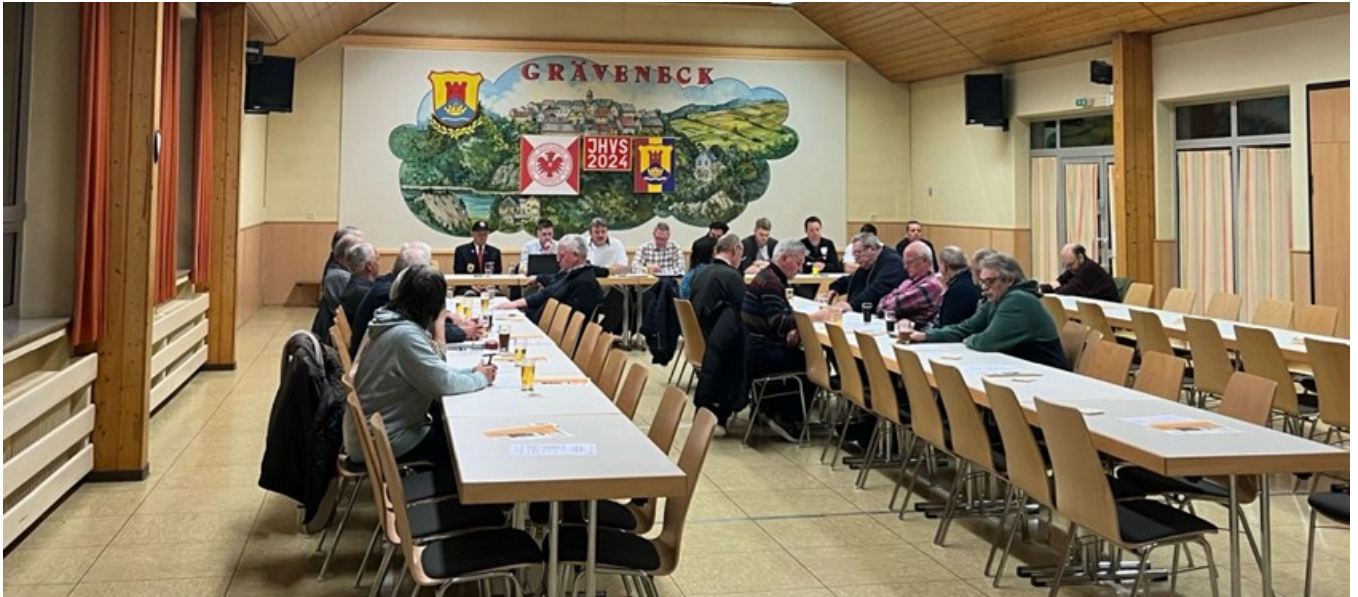
Blick in die Mehrzweckhalle bei der JHV des TuS Gräveneck am 02.03.2024