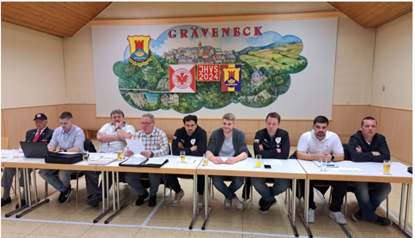
Der TuS Vorstand beim Vortragen der Rechenschaftsberichte fürs Jahr 2023